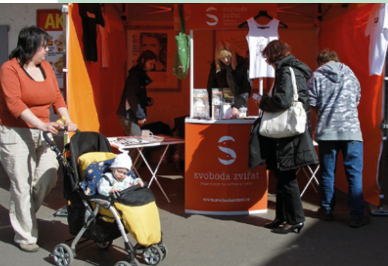
Informační stánek ke Světovému dni laboratorních zvířat

U příležitosti 24. dubna – Světového dne laboratorních zvířat, jsme zorganizovali několik akcí. Ve čtvrtek 22. dubna jsme v Praze uspořádali informační stánek zaměřený především na pokusy na zvířatech. V sobotu 24. dubna také přibližně stovka dobrovolníků rozdávala po celé České republice seznamy kosmetiky a prostředků pro domácnost netestovaných na zvířatech. O pokusech na zvířatech informovala také média – např. ČRo2 a Rádio Česko.