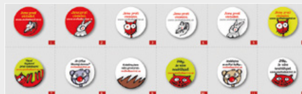
Některé z benefitních placek Svobody zvířat, cena 25 Kč/ks

Pro členy Sz 10% sleva na všechny placené produkty. Další informační materiály hledejte na www.svobodazvirat.cz .