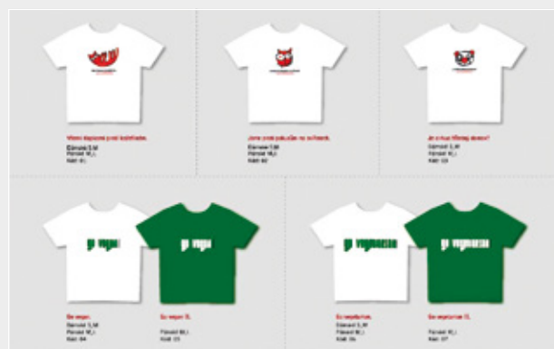
Benefitní trička Svobody zvířat, cena 250 Kč/ks