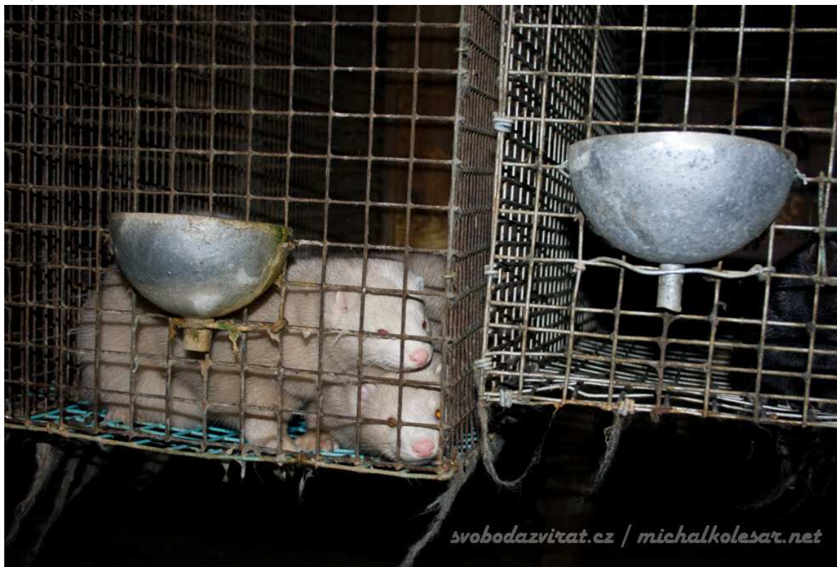
6 Norci na farmě v Křížanovicích